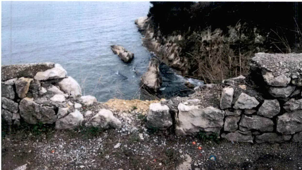
Fotografija sadašnjeg stanja na lokaciji

Imajući u vidu da se radi o radovima koji predstavljaju adaptaciju i održavanje postojećeg objekta, to u smislu člana 5. tačka 1. Zakona o uređenju prostora i izgradnji objekata navodimo da se radovi izvode kao tekuće investiciono održavanje postojećeg stanja obale.